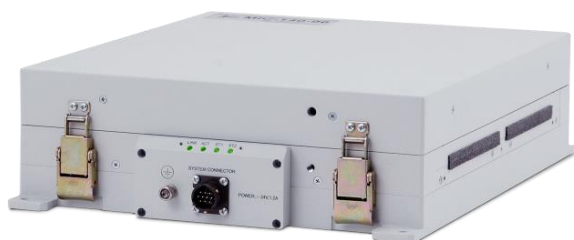
Рисунок 1 – Общий вид комплексов МІС-140

Общий вид комплексов приведен на рисунках 1 – 12.