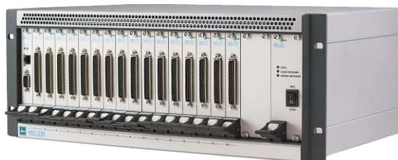
Рисунок 8 – Общий вид комплексов MIC-236, MIC-246, MIC-320