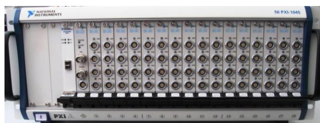
Рисунок 10 – Общий вид комплексов MIC-551 PXI, MIC-552 PXI, MIC-553 PXI, MIC-521PXI, MIC-522PXI, MIC-523PXI