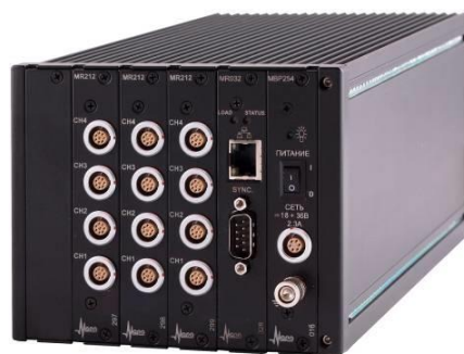
Рисунок 6 – Общий вид комплексов MIC-221, MIC-222, MIC-223, MIC-224, MIC-225, MIC-226