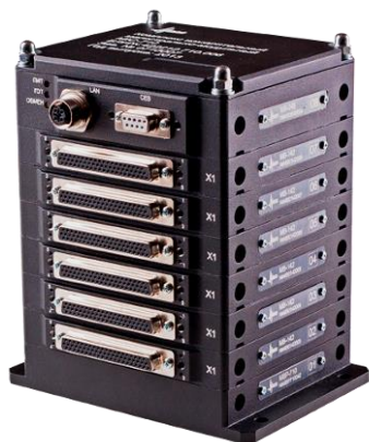
Рисунок 11 – Общий вид комплексов МІС-710