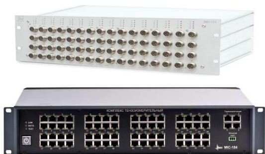
Рисунок 3 – Общий вид комплексов МІС-184