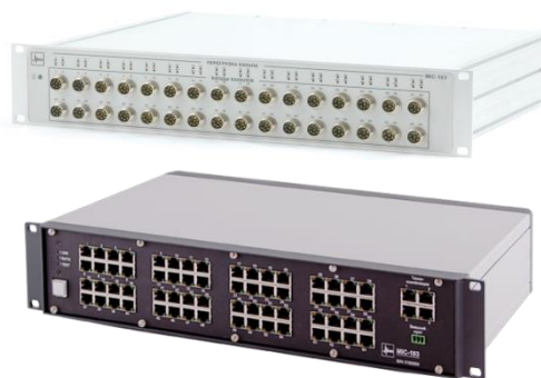
Рисунок 2 – Общий вид комплексов МІС-183