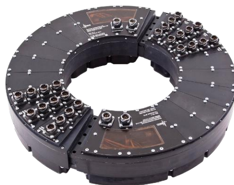
Рисунок 12 – Общий вид комплексов МІС-1100

Пломбирование комплексов от несанкционированного доступа производится путем приклеивания разрушающихся наклеек на съемные крышки корпусов комплексов.