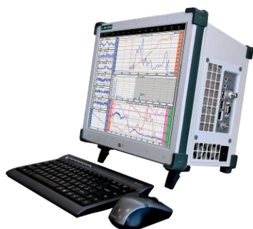
Рисунок 9 – Общий вид комплексов MIC-325, MIC-355 M