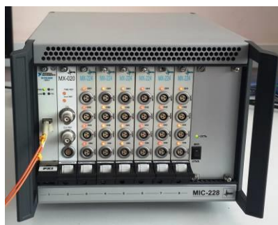
Рисунок 7 – Общий вид комплексов MIC-228