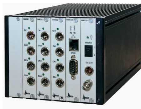
Рисунок 4 – Общий вид комплексов МІС-251 М, МІС-252 М, МІС-253 М, МІС-254 М, МІС-255 М, МІС-256 М